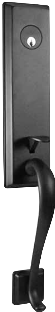
HOLBROOK Noir mat