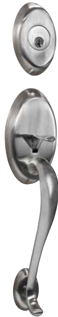
SUFFOLK Nickel satiné