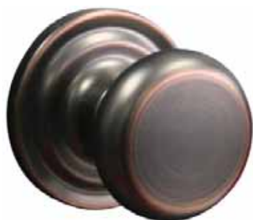
MONTAUK Bronze antique

Pour portes de 1 3/8" (35mm) à 1 3/4" (45mm) d'épaisseur • Vis de montage dissimulées • Écartement ajustable pour 2 3/8" (60mm) et 2 3/4" (70mm) • Plaque de montage fait d'acier galvanisé et de zinc coulé et bouton en laiton • Pêne dormant en laiton avec tige à rotation libre en acier durci et course de 1" (25mm) • Profil Weiser • Installation facile avec gabarit