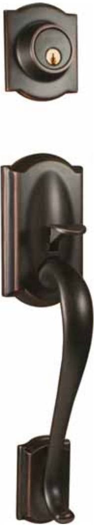
CARRAWAY Bronze antique

Garniture extérieure en laiton massif • Pour portes de 1 3/4" (44mm) à 2" (51mm) d'épaisseur, 2 1/4" (57mm) disponible • Écartement ajustable pour 2 3/8" (60mm) et 2 3/4" (70mm) • Mécanisme intérieur fait d'acier galvanisé de laiton et de zinc coulé • Cylindre reclavetable en laiton massif à 5 goupilles • Pêne dormant en laiton avec tige à rotation libre en acier durci et course de 1" (25mm) • Espacement centre à centre des trous de 5 1/2" (140mm) • Profil Weiser • Installation facile avec gabarit