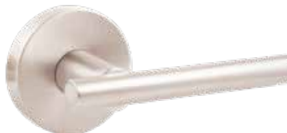
CIRCA NICKEL SATINÉ