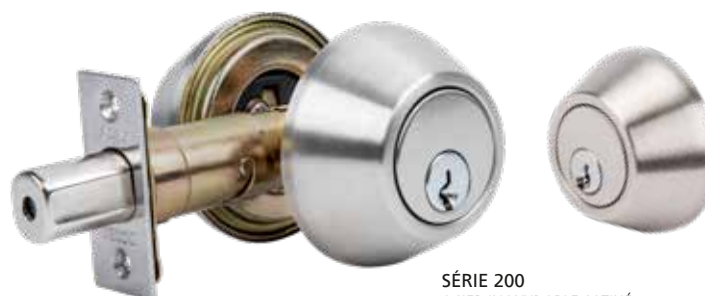
SÉRIE 200 ACIER INOXYDABLE SATINÉ CYLINDRE DOUBLE