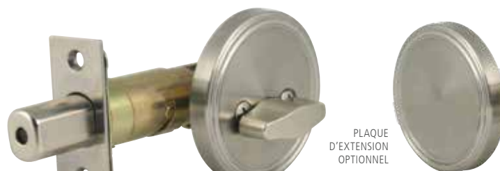
PLAQUE D'EXTENSION OPTIONNEL