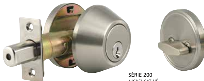
SÉRIE 200 NICKEL SATINÉ CYLINDRE SIMPLE