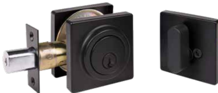
METRO CARRÉ NOIR MAT CYLINDRE SIMPLE