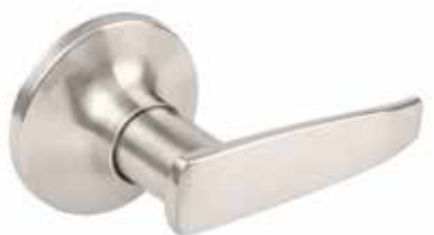
EARL NICKEL SATINÉ