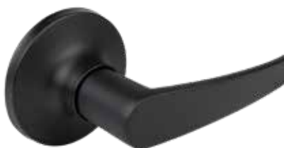
STRAIGHT NOIR MAT