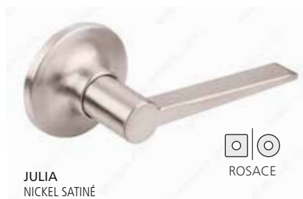
JULIA NICKEL SATINÉ