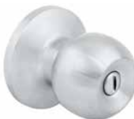
RONDO CHROME SATINÉ