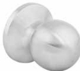
RONDO CHROME SATINÉ