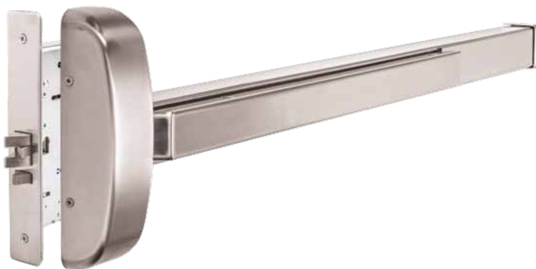
MODÈLE LHR PRÉSENTÉ