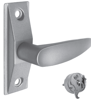
POIGNÉE MAIN DROITE (RH) ILLUSTRÉE