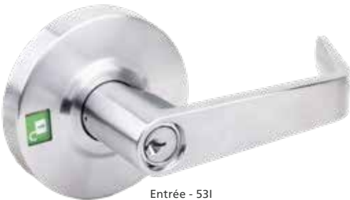
Entrée - 53I