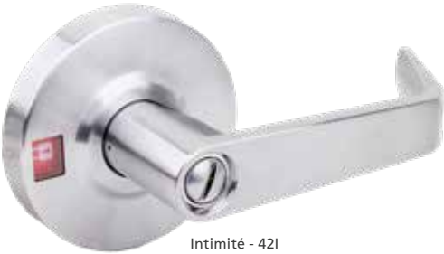
Intimité - 42I