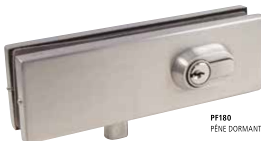
PF180 PÊNE DORMANT