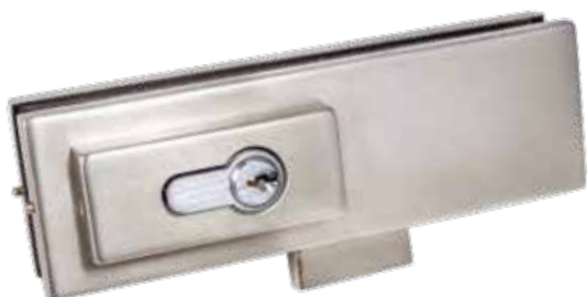
PF181 PÊNE DORMANT